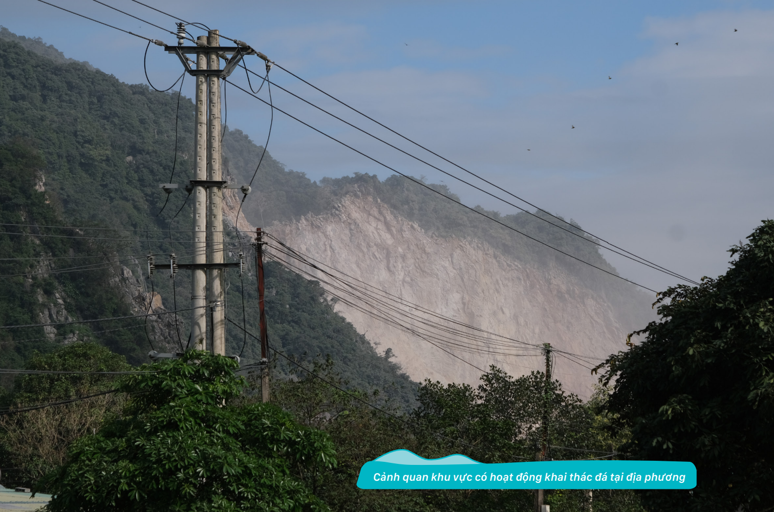
Cảnh quan khu vực có hoạt động khai thác đá tại địa phương

Tôi thấy dự án này hợp với nơi mình. Đây là chỉ dẫn quan trọng cho các dự án phát triển: Dự án hỏi bà con có muốn trồng măng hay không. Tôi tham gia ngay. Họ hướng dẫn loại măng phù hợp với địa hình.