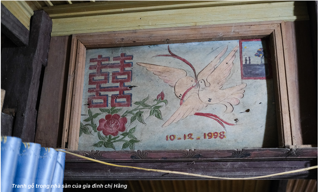
Tranh gỗ trong nhà sàn của gia đình chị Hằng