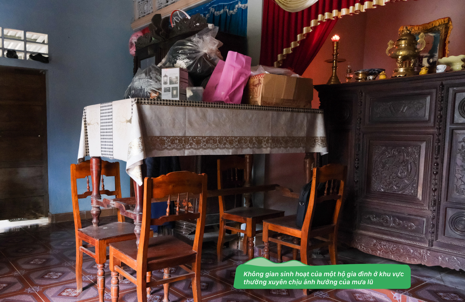
Không gian sinh hoạt của một hộ gia đình ở khu vực thường xuyên chịu ảnh hưởng của mưa lũ

Ví dụ điển hình, chuyện dự báo lũ. Hiện nay đã có các mức đánh giá lũ, nhưng người dân quê tôi họ có cách dự báo riêng, gắn liền với tự nhiên. Họ nói: “Cái bông, cái hoa đó mà nở ra là chắc chắn sẽ có lũ”. Cái cây đó mọc tự nhiên ở quê hương mình, đó là kinh nghiệm được cha ông truyền lại qua nhiều đời.