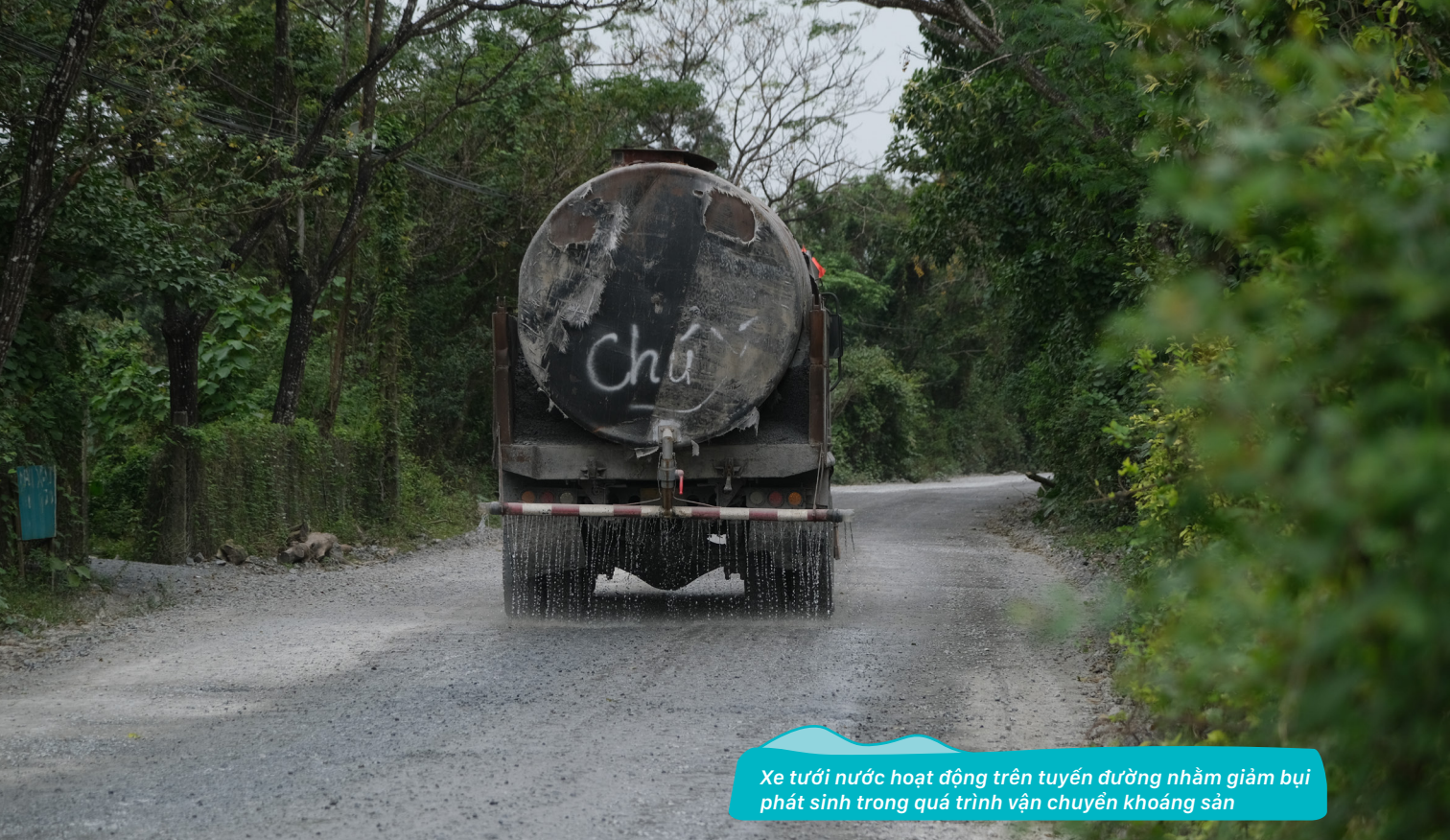
Xe tưới nước hoạt động trên tuyến đường nhằm giảm bụi phát sinh trong quá trình vận chuyển khoáng sản

Câu chuyện của tôi và bà con Vân Kiều bắt đầu từ tháng 10 năm 2022, khi HTX Măng Giang Trường Xuân được thành lập. Lúc đó, chúng tôi có bảy thành viên, trong đó có một nam và sáu nữ; hai là người Kinh, năm người là đồng bào Vân Kiều. Mục tiêu lớn nhất của HTX là tạo việc làm cho đồng bào dân tộc thiểu số. Bà con đã liên kết với HTX từ khi thành lập đến hôm nay.