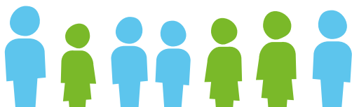
Evolución de la pobreza por género

Aunque los hogares con jefatura femenina tienen un nivel de pobreza inferior en unos cinco puntos porcentuales en comparación con los de jefatura masculina, el impacto del COVID-19 y la pospandemia indican que los primeros han tenido más dificultades para reducir la pobreza luego del shock de la pandemia, y lo que es más preocupante, están mostrando una tendencia más pronunciada al incremento de la pobreza en la etapa pospandémica en el contexto de profundización de la crisis.