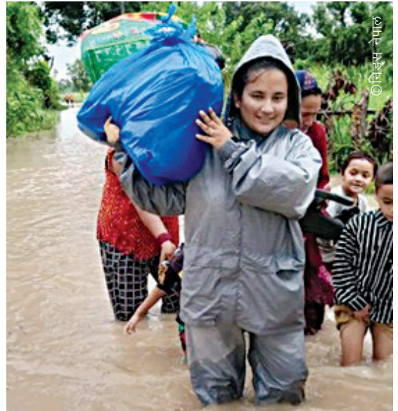
कञ्चनपुर जिल्लाको दोधारा चाँदनी नगरपालिकामा पर्ने प्रगति टोलकी आकृति कसेरा बाढीपछि मानिसहरूलाई सुरक्षित स्थानतर्फ जान सहयोग गर्दै ।

यो समुदायले हावाहुरी, तातो लहर (लु), चट्याङ र जंगली जनावरहरूको निरन्तर आक्रमण जस्ता समस्याहरू पनि भेल्दै आएको थियो । कृषि र दैनिक ज्याला मजदुरी नै आम्दानीको मुख्य स्रोत भएकाले धेरै पुरूषहरू कामको खोजीमा भारततर्फ पलायन हुन बाध्य थिए । यसले