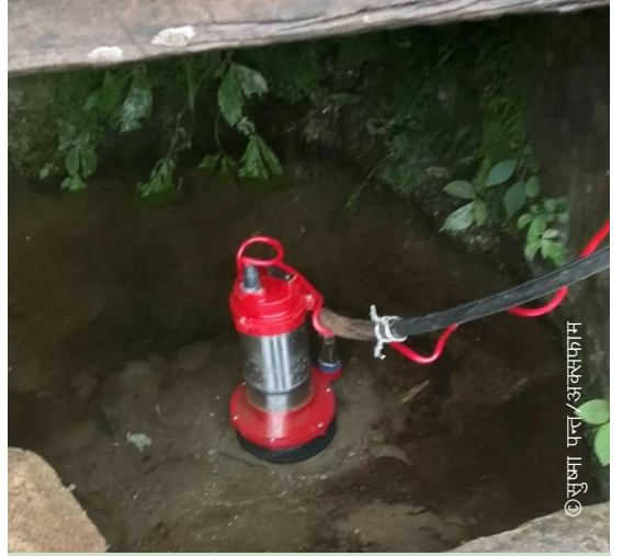
नयाँ मोटरपम्प उपलब्ध गराएपछि पुनः सुचारु भएको खानेपानी प्रणाली । यो एक अस्थायी द्रुत समाधान हो ।

यस घटना उदाहरणले छरिएका र खण्डित खानेपानी प्रणालीका चुनौतीहरूलाई चित्रण गर्दछ । वैकल्पिक व्यवस्थापन मोडलले यस्ता प्रणालीहरूलाई खानेपानी व्यवस्थापन बोर्डहरूमार्फत एकीकृत गरी सबैका लागि थप भरपर्दो, जवाफदेही र समतामूलक सुरक्षित पानीमा पहुँच सुनिश्चित गर्ने लक्ष्य राखेको छ ।