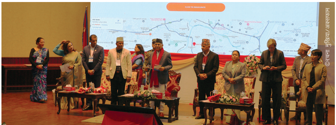
पूर्व प्रधानमन्त्री केपी शर्मा ओली नेपाल कन्ट्री इनइक्वालिटी रिपोर्ट २०२५ को सारांश सार्वजनिक गर्दै ।

यो प्रतिवेदन डेस्क रिसर्च र सरोकारवालाहरूसँगको परामर्शमा आधारित एक गुणात्मक र तथ्यपरक अध्ययन हो । यसमा सरकारी प्रतिवेदन, प्राज्ञिक लेख, नीतिगत संक्षेप, अनुसन्धानमूलक अध्ययन, नागरिक समाजका प्रकाशन र राष्ट्रिय तथा अन्तर्राष्ट्रिय संस्थाहरूका तथ्याङ्कहरू प्रयोग गरिएको छ । अध्ययनका लागि सन् २०१५ पछिका प्रकाशित र अप्रकाशित दुवै खालका दस्तावेजहरूको समीक्षा गरिएको थियो । प्रतिवेदनको विश्लेषणात्मक गहिराइ, एकरूपता र असमानतासम्बन्धी राष्ट्रिय एवं विश्वव्यापी बहसहरूसँगको सामञ्जस्यता सुनिश्चित गर्न अध्ययन गरिएका प्रत्येक विषयगत खण्डलाई विज्ञहरूद्वारा परीक्षण गरिएको थियो ।