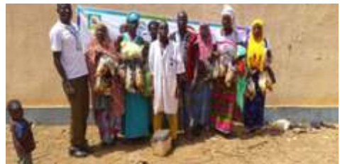
Distribution de la volaille à Boulsa le 25 mai 2024