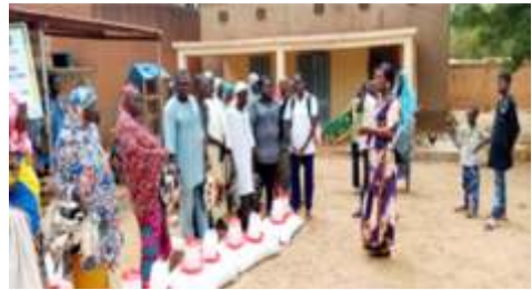
Conseils de la 2 è Vice-Présidente de la Délégation Spéciale de la commune de Kaya lors de la remise des kits volailles, des aliments et du petit matériel aux bénéficiaires de Kaya