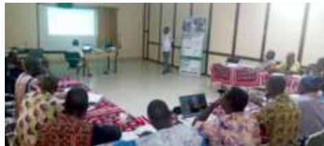
Présidium de l'atelier de formation des formateurs sur les résolutions 1325 et 2250 des Nations Unies et suivants au Burkina au profit des acteurs humanitaires de la province du Sanmatenga, Kaya.