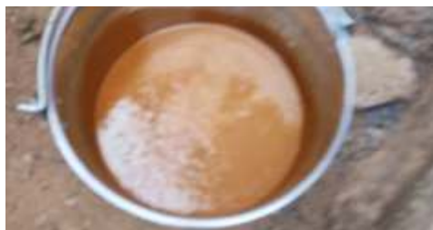
Vu de profil de la pâte d'arachide