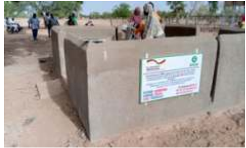
A 2.4 : Réhabiliter 6 forages PMH