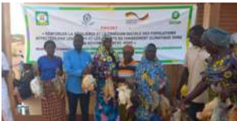
Distribution de la volaille à Kongoussi le 6 juin 2024