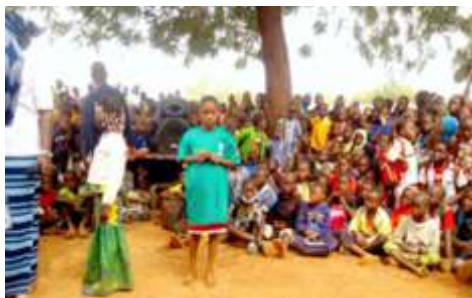
Echanges après l'animation du théâtre-forum lors de la séance d'éducation environnementale au niveau de l'école Centre B de Kaya, le 27 novembre 2024