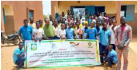
Photo de famille des participants à la première séance d'éducation sur les bonnes pratiques d'adaptation et d'atténuation aux effets du changement climatique à Kongoussi