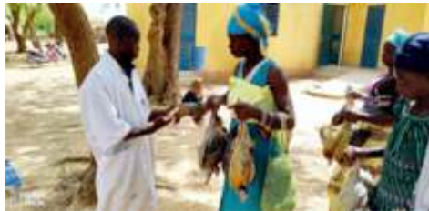
Distribution de la volaille à Boulsa le 25 mai 2024