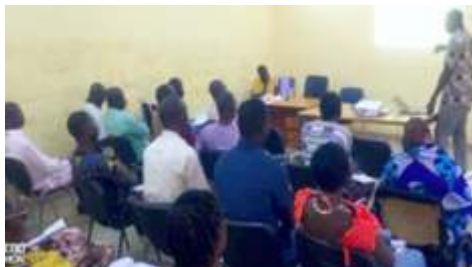
Une vue des participants à l'atelier de formation des acteurs locaux sur la promotion des actions de lutte contre les effets du changement à Boulsa