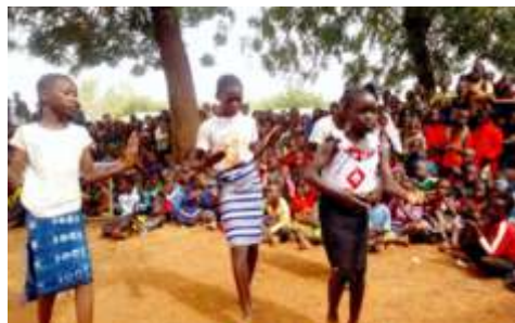
Représentation du théâtre-forum par des élèves lors de la séance d'éducation environnementale au niveau de l'école Centre B de Kaya, le 27 novembre 2024