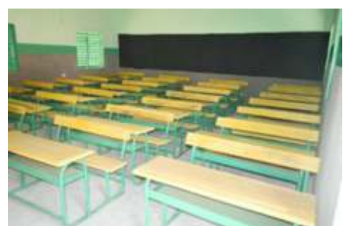
A 2.6. Equiper 9 salles de classes pour augmenter la capacité d'accueil