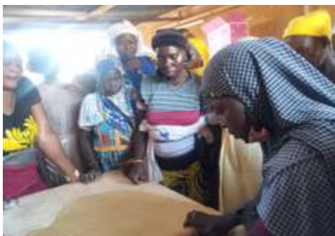
Préparation de la pâte par les participantes à la formation sur la transformation de gâteau, à Kaya du 12 au 17 décembre 2024