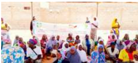
Séance de sensibilisation des populations de Begonogo, commune de Kaya, sur l'impact de la coupe abusive du bois des feux de brousse, et la divagation des animaux par le CODESUR Kaya