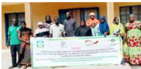
Photo de famille participantes à la session de renforcement des capacités des responsables des deux micros entreprises en gestion de micro-entreprise, réalisée à Kaya, du 12 au 13 novembre 2024