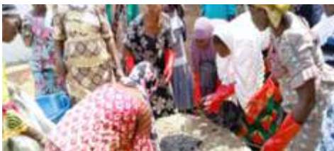
Séance de démonstration de la fabrication du bokashi lors de la formation en techniques de cultures hors sol, à Kaya