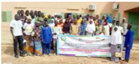
Photo de famille des participants à la 1ère séance d'éducation sur les bonnes pratiques d'adaptation et d'atténuation aux effets du changement climatique à Boulsa