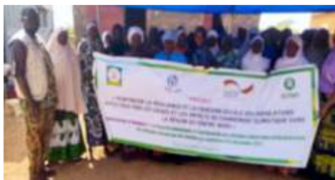
Photo de famille des participantes à la 2 e session de formation sur la transformation de grains d'arachide, à Kaya, du 18 au 19 décembre 2024