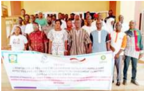
Photo de famille des participants à l'atelier de renforcement des capacités des acteurs locaux de Kaya en médiation, négociation et communication non violente, réalisée du 16 au 17 avril 2024