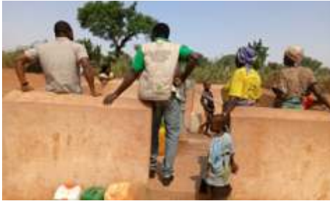
A 2.3 : Réaliser 6 forages PMH pour les villages ruraux déficitaires