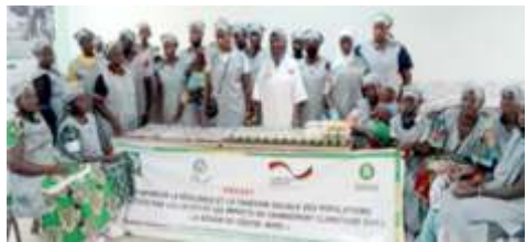
Vu d'ensemble des produits (biscuit et poudre de Moringa) fabriqués par les participantes de Kaya