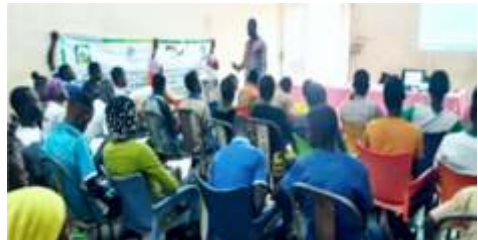
Animation de la première séance d'éducation sur les bonnes pratiques d'adaptation et d'atténuation aux effets du changement climatique à Kongoussi