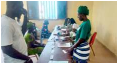
Rencontre d'échanges entre le Réseau des Caisses Populaires et les bénéficiaires de Kongoussi