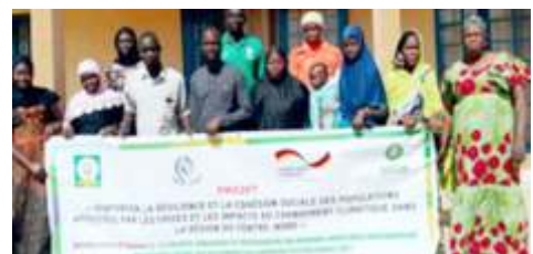
Photo de famille participantes à la session de renforcement des capacités des responsables des deux micros entreprises en gestion de micro-entreprise, réalisée à Kaya, du 12 au 13 novembre 2024