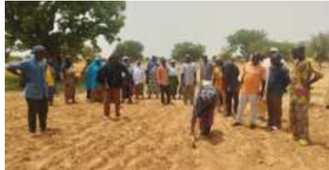
Démonstration des semis par les participants de Dahisma et de Koulogo lors de la formation des producteurs/trices sur les itinéraires techniques de production de niébé et du sorgho, réalisée le 29 juin 2024 à Dahisma