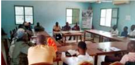
Ouverture du cadre de concertation du SAP de Kaya sur le bilan des activités, tenu le 10 décembre 2024