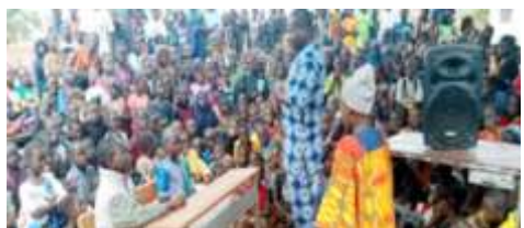
Vu partielle de la mobilisation des élèves lors de la séance d'éducation environnementale au niveau de l'école Centre B de Kaya, le 27 novembre 2024