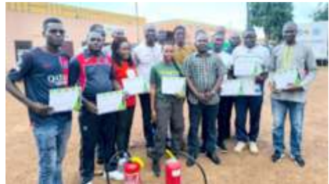
5.1.4 Former les partenaires opérationnels et l'équipe projet sur la sécurité