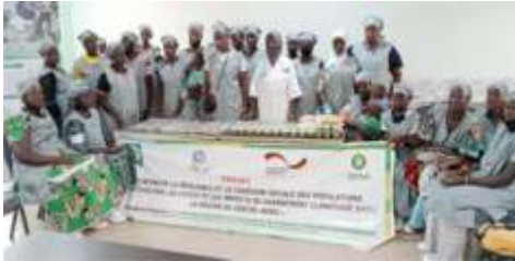
Formation des femmes et jeunes sur les techniques de transformation et conservation des produits agricoles à Kaya, du 30 au 31 juillet 2024