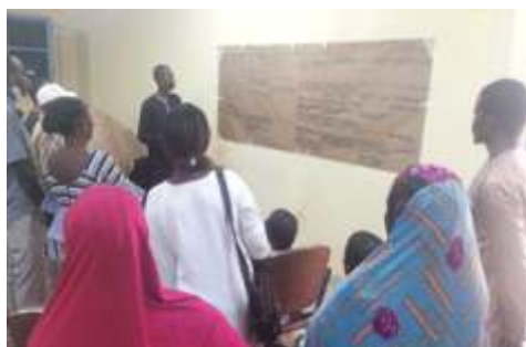
Travaux de groupe sur l'analyse des risques et de vulnérabilité dans la commune de Boulsa