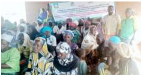
Séance de sensibilisation des populations du site PDI de Tiweïga II, commune de Kaya, sur l'impact de la coupe abusive du bois des feux de brousse, et la divagation des animaux par le CODESUR Kaya