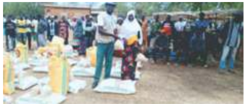
Remise de kits d'intrants agricoles à Kongoussi