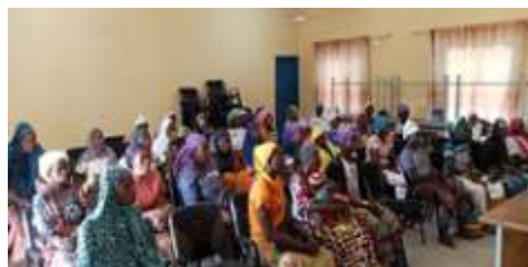
Vu partiel des participantes à la session de formation des femmes et jeunes en entrepreneuriat à Kaya, du 13 au 14 décembre 2024