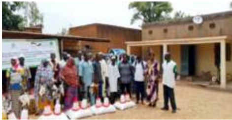
Remise des kits volailles, petits matériels et aliments aux bénéficiaires de la commune de Kaya réalisée le 12 juillet 2024