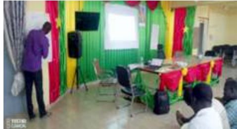
Animation de l'atelier de formation des acteurs communaux et administratifs sur la prévention, la gestion des crises et des risques de catastrophes par le DPAHSN Bam