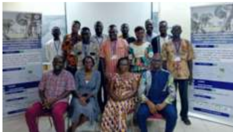
5.1.3 Capitaliser et Renforcer les capacités sur la gestion de la ligne verte et l'analyse des feedbacks