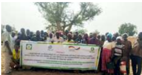
Photo de famille des participants de Silmiougou et de Damanè à la session de formation des producteurs/trices sur les itinéraires techniques de production du niébé et du sorgho, réalisée le 28 juin 2024, à Silmiougou