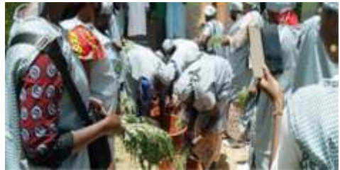
Formation des femmes et jeunes sur les techniques de transformation et conservation des produits agricoles à Kaya, du 30 au 31 juillet 2024