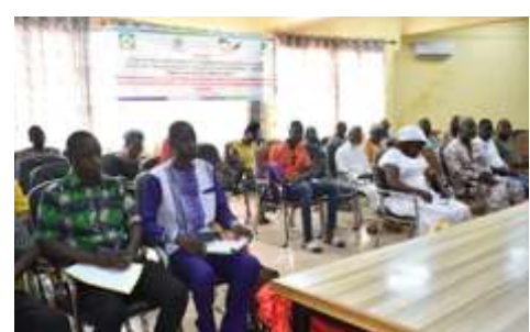
Vu partielle des participants à l'atelier de renforcement des capacités des acteurs locaux en médiation, négociation et communication non violente, réalisée du 17 au 19 avril 2024 à Boulssa