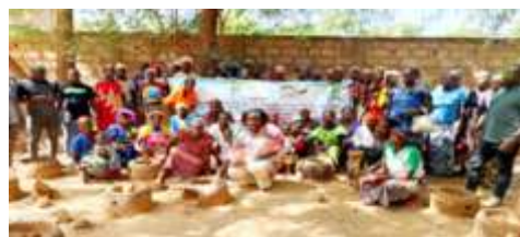
Photo de famille des participants à la clôture de la session de renforcement des capacités des femmes sur les techniques de construction des foyers améliorés, réalisée 5 au 7 novembre 2024 à Kaya