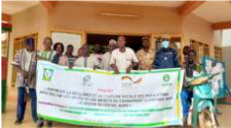
Photo de famille des participants de l'atelier de formation des acteurs communaux et administratifs sur la prévention, la gestion des crises et des risques de catastrophes, organisée du 2 au 3 mai 2024 à Koungoussi