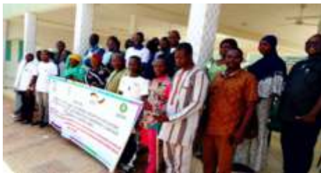
Photo de famille lors de l'atelier d'échanges et d'élaboration du plan d'action CODESUR Kaya, tenu le 8 octobre 2024