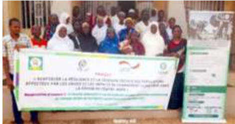
Photo de familles des participants de la session 2 de la formation en techniques d'aviculture, à Kaya