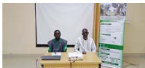
Présidium de l'atelier de formation des formateurs sur les résolutions 1325 et 2250 des Nations Unies et suivants au Burkina au profit des acteurs humanitaires de la province du Sanmatenga, Kaya.