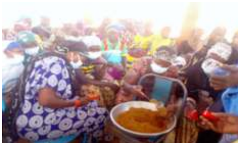
Emballage de la poudre du Soubala au piment, réalisée du 12 au 13 décembre 2024, à Kaya