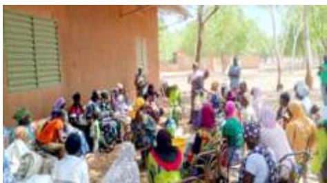
Ouverture par le chargé de projet de la session de formation des bénéficiaires en techniques de saponification, réalisée à Kaya, du 11 au 12 décembre 2024