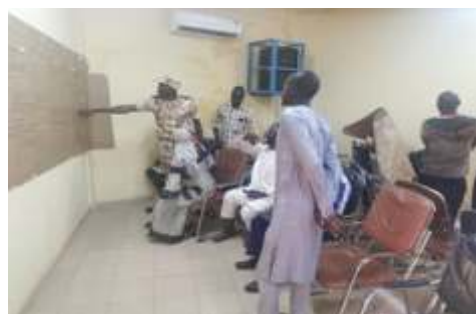
Travaux de groupe sur l'analyse des risques et de vulnérabilité dans la commune de Boulsa