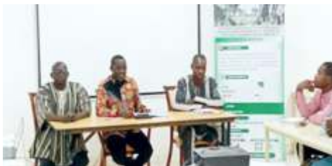
Présidium à l'ouverture de l'atelier diagnostic préparatoire d'analyse des risques et de la vulnérabilité avec le groupe de savoir dans la commune de Kaya, par Mr le Haut-Commissaire de la province du Sanmatenga, tenue du 16 au 17 décembre 2024