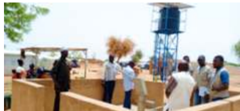
A.2.2 : Transformer 5 forages Pompe à motricité humaine (PMH) en poste d'eau autonome (PEA) pour les villages périphériques des centres urbains et gros villages ruraux