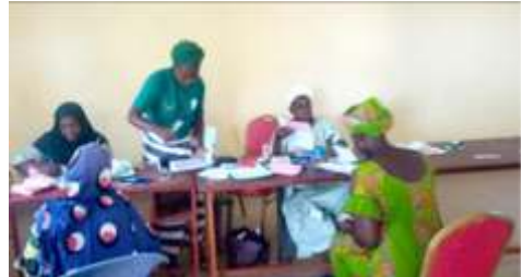
Ouverture des comptes par les bénéficiaires de Kongoussi