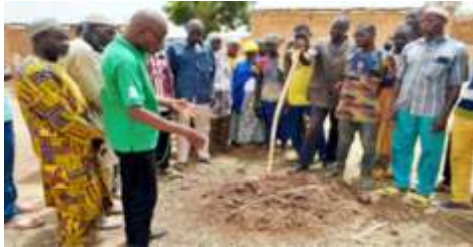
formation des producteurs/trices de Dahisma et de Koulogo sur les itinéraires techniques de production de niébé et du sorgho, réalisée le 29 juin 2024 à Dahisma