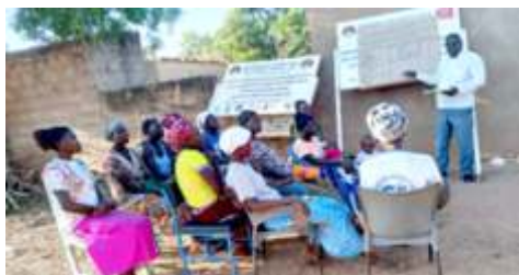
Auto-évaluation d'une micro-entreprise à Kongoussi