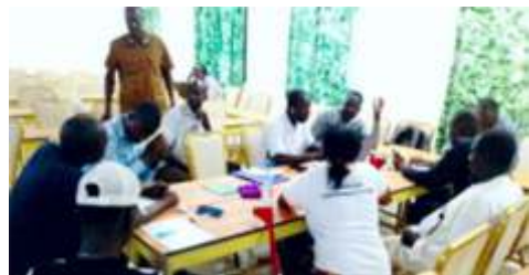
Travaux de groupe lors de l'atelier d'échanges et d'élaboration du plan d'action CODESUR Kaya, tenu le 8 octobre 2024