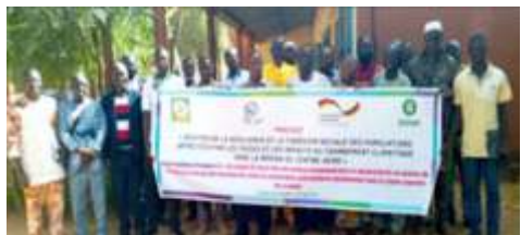
Photo de famille des participants à l'atelier de renforcement des capacités des membres du SAP y compris les CVD de Kaya sur les stratégies de préventions, d'anticipation ou de réponse en cas de survenus de crises et de catastrophes