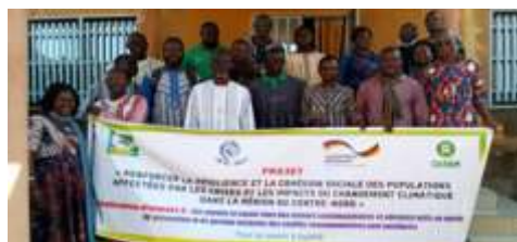
Photo de famille des participants à la formation des formateurs sur les résolutions 1325 et 2250 des Nations Unies et suivants au Burkina au profit des acteurs humanitaires de la province du Sanmatenga, réalisée du 2 au 6 décembre 2024