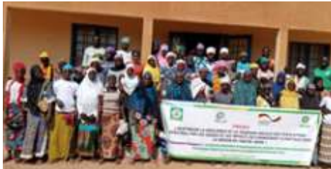
Photo de famille des participantes à la session de formation des femmes et jeunes en entrepreneuriat à Kaya, du 11 au 12 décembre 2024