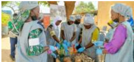
Fabrication de biscuits à base de pain de singe et de la poudre des feuilles de Moringa par les participantes de Kaya