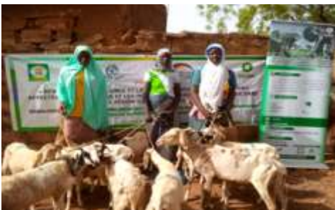
Bénéficiaires en possession de leurs animaux naisseurs dotés par le projet BMZ dans la commune de Kongoussi