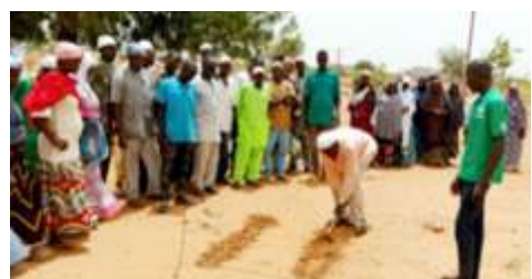
Séance de démonstration des écartements de semis lors de la formation des bénéficiaires de Koutla-Yarcé et de Delga, réalisée le 28 juin 2024, à Koutla-Yarcé