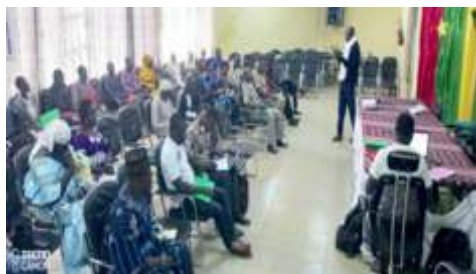
Plénière atelier d'analyse des risques et de vulnérabilité dans la commune de Boulsa