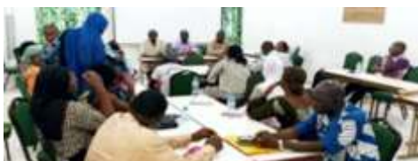
Clôture de la session de renforcement des capacités des acteurs communautaires sur la promotion des actions de lutte contre les effets du changement à Kaya