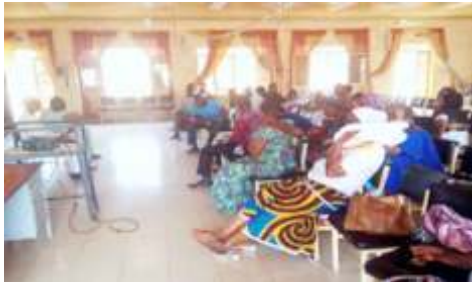
Séances de jeu de rôle à l'atelier de renforcement des capacités des acteurs locaux en médiation, négociation et communication non à Kongoussi