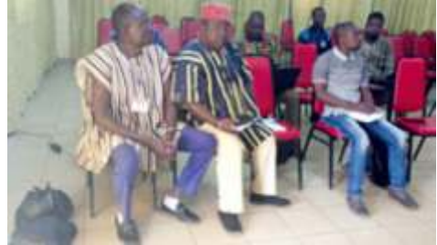
Vue partielle des participants des participants à l'atelier d'information sur la sécurité alimentaire et nutritionnelle à Boulsa