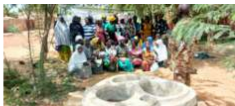
Phase Pratique de la formation des femmes sur les techniques de construction de foyers améliorés à Kongoussi