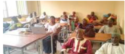
Vu partiel des participants en salle lors de la de formation en techniques d'aviculture dans la commune de Kaya