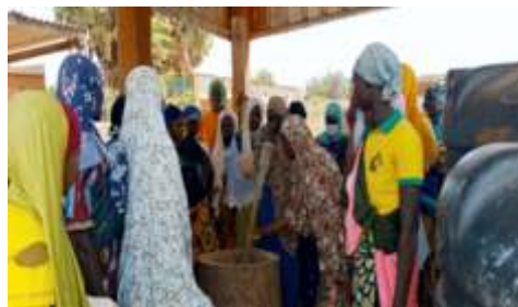
Mouture du soubala par les participantes lors de la formation sur la transformation des grains de néré en soubala réalisée du 12 au 13 décembre 2024