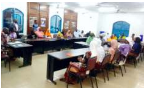
Vue des participants à la formation sur les résolutions 1325 et 2250 des Nations Unies au Burkina au profit des organisations membres de la CCF et du CCJ de la commune de Kaya, du 18 au 19 décembre 2024