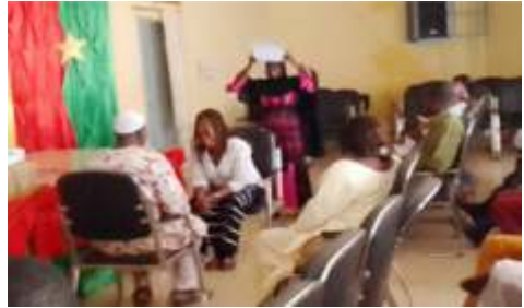
Séances de jeu de rôle à l'atelier de renforcement des capacités des acteurs locaux en médiation, négociation et communication non à Boulsa