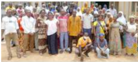
Photo de famille des participants des deux sessions de formation en techniques d'aviculture en présence du DPRAH Sanmatenga, Kaya