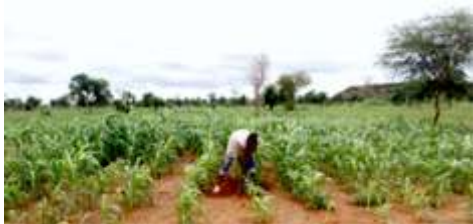
Vu d'un champ de sorgho d'un bénéficiaire d'intrants agricoles à Zablo