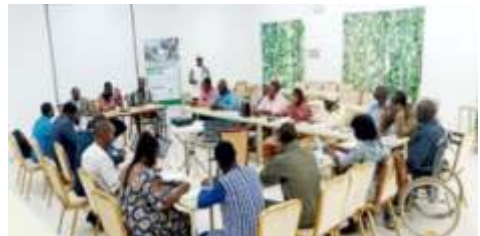
Séance d'ouverture de l'atelier diagnostic préparatoire d'analyse des risques et de la vulnérabilité avec le groupe de savoir dans la commune de Kaya, tenue du 16 au 17 décembre 2024