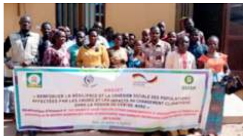
Photo de famille des participants à l'atelier de formation des acteurs locaux sur la promotion des actions de lutte contre les effets du changement à Boulsa