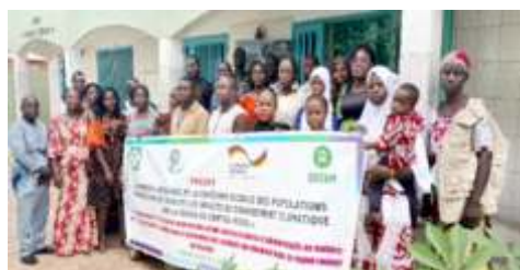
Photo de famille des participants à la session de renforcement des capacités des acteurs communautaires sur la promotion des actions de lutte contre les effets du changement climatique réalisée 24 au 25 octobre 2024 à Kaya