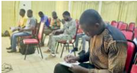
Participants à l'atelier de partage des informations sur la situation sécuritaire et nutritionnelle à Kongoussi