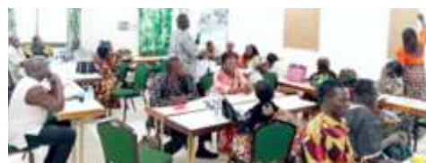
Travaux de groupes lors de la session de renforcement des capacités des acteurs communautaires sur la promotion des actions de lutte contre les effets du changement climatique à Kaya