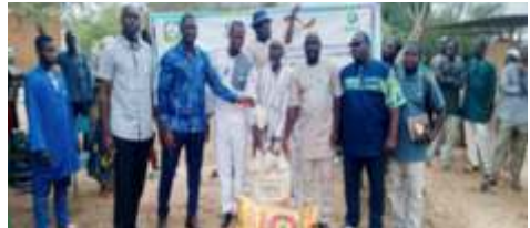
Remise de kits d'intrants agricoles à Boula