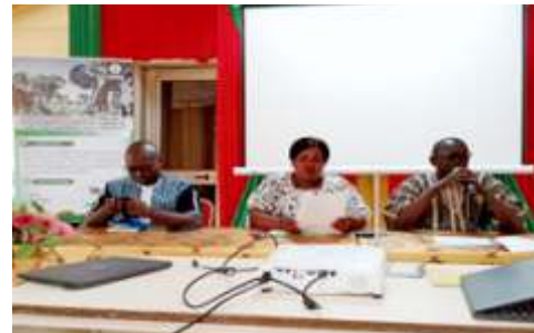
Ouverture de l'atelier de renforcement des capacités des acteurs locaux de Kaya en médiation, négociation et communication non violente