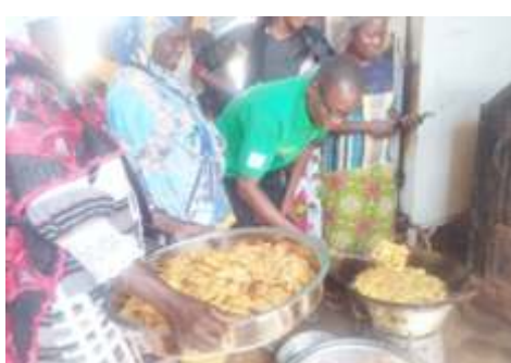
Friture des Gâteaux par les participantes de Kaya