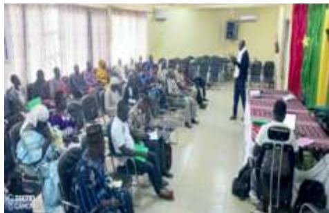
Plénière atelier d'analyse des risques et de vulnérabilité dans la commune de Boulsa