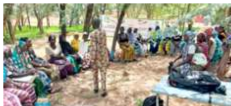
Phase Pratique de la formation des femmes sur les techniques de construction de foyers améliorés à Kongoussi