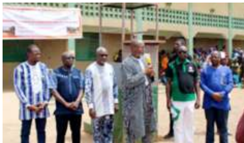
Participants à la remise officielle des infrastructures du projet BMZ aux autorités de la région du Centre-Nord