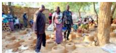
Supervision des travaux de réalisation des foyers améliorés par le DP en charge de l'Environnement de la Province du Sanmatenga, Kaya