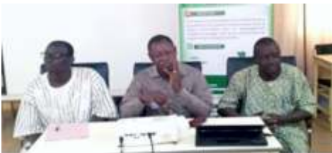
Présidium de l'atelier de renforcement des capacités des membres du SAP y compris les CVD de Kaya sur les stratégies de préventions, d'anticipation ou de réponse en cas de survenus de crises et de catastrophes, tenu le 22 novembre 2024