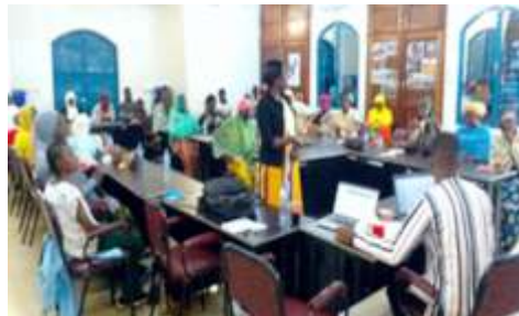
Plénière de la formation sur les résolutions 1325 et 2250 des Nations Unies au Burkina au profit des organisations membres de la CCF et du CCJ de la commune de Kaya, du 18 au 19 décembre 2024