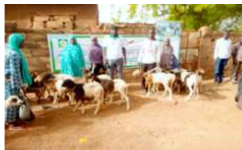
Bénéficiaires en possession de leurs animaux naisseurs dotés par le projet BMZ dans la commune de Kongoussi