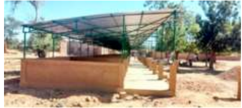
A 2.9. Construire 3 boutiques marchandes de rue (un bloc de 5 boutiques/commune)