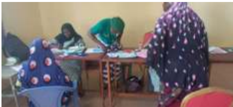
Ouverture des comptes par les bénéficiaires de Kongoussi