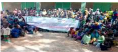
Photo de famille des participants à la séance d'éducation environnementale sous forme de théâtre-forum, tenue à l'école Sibiougou A de Kaya, le 30 novembre 2024