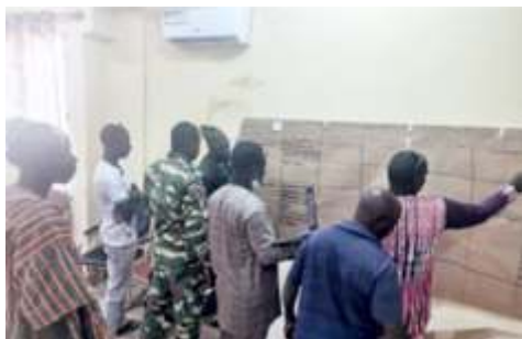
Travaux de groupe sur l'analyse des risques et de vulnérabilité dans la commune de Boulsa