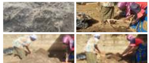
Retournement du Bokashi par les participantes à Kaya