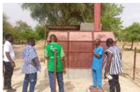
A 2.7. Réaliser/réhabiliter 3 incinérateurs pour des formations sanitaires