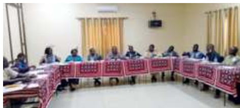
Photo de famille des participants à la formation des formateurs sur les résolutions 1325 et 2250 des Nations Unies et suivants au Burkina au profit des acteurs humanitaires de la province du Sanmatenga, réalisée du 2 au 6 décembre 2024