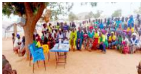
Vu d'ensemble des participants après la séance de sensibilisation sur la coupe abusive du bois, les feux de brousse et la divagation des animaux sur le site de Sougre-noma, commune de Kaya