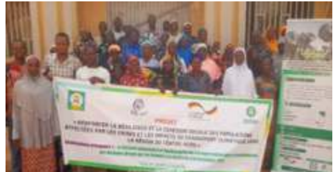
Photo de familles des participants de la session 1 de la formation en techniques d'aviculture, à Kaya