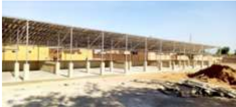
A 2.8. Construire 3 marchés de fruits et légumes (un bloc au moins de 5 hangars/commune)