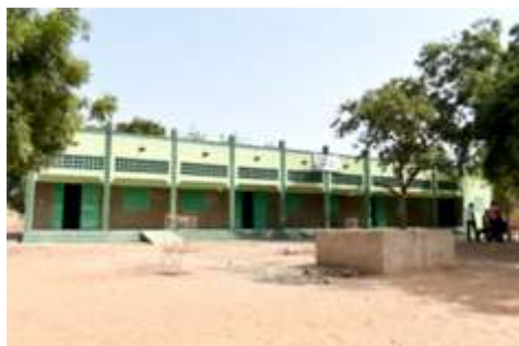
A 2.5. Construire 3 complexes scolaires primaires (9 salles de classe + Bureau + Magasin + latrines)