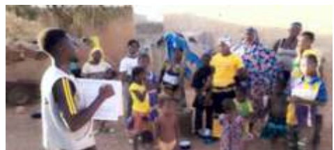
Séance de sensibilisation des populations de Kaya sur l'hépatite E par le district sanitaire de Kaya, membre de CODESUR Kaya