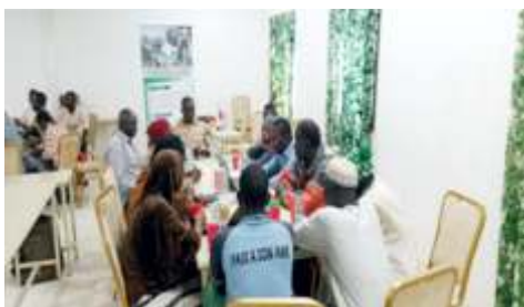
Groupe de travail sur le processus de changement social pour les communautés de Kaya