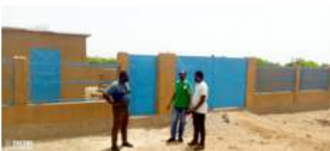
A.2.1 : Réaliser 3 forages à gros débit (>7m 3 /h) connectés au réseau ONEA