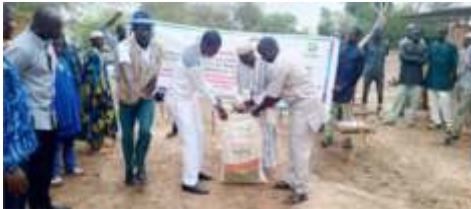
Distribution de kits d'intrants agricoles à Kongoussi du 23 au 24 Mai 2024