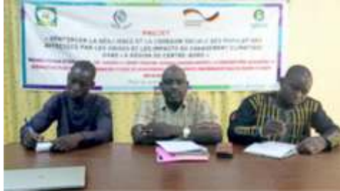
Présidium de l'atelier de présentation de la situation sécuritaire et nutritionnelle de Boulsa