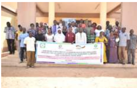
Photo de famille des participants à l'atelier de renforcement des capacités des acteurs locaux en médiation, négociation et communication non violente, réalisée du 17 au 19 avril 2024 à Boulssa