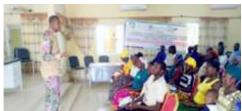
Animation de la 2è séance d'éducation sur les bonnes pratiques d'adaptation et d'atténuation aux effets du changement climatique à Boulsa