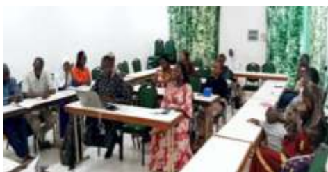
Vue partielle des participants à la session de renforcement des capacités des acteurs communautaires sur la promotion des actions de lutte contre les effets du changement climatique réalisée 24 au 25 octobre 2024 à Kaya