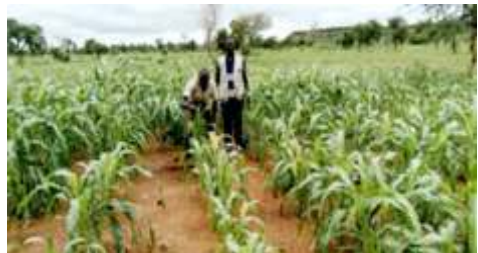
Vu d'un champ de sorgho d'un bénéficiaire d'intrants agricoles à Zablo