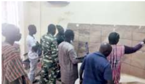
Travaux de groupe sur l'analyse des risques et de vulnérabilité dans la commune de Boulsa