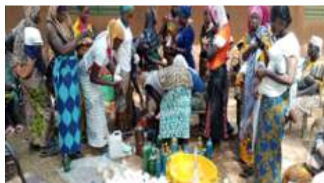
Travaux pratiques de fabrication de savons par les participantes à Kaya