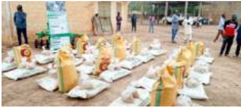
Distribution de kits d'intrants agricoles à Boulsa du 23 au 24 Mai 2024