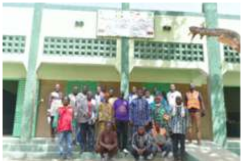
A 2.5. Construire 3 complexes scolaires primaires (9 salles de classe + Bureau + Magasin + latrines)