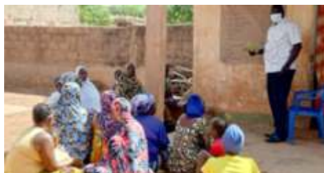
Auto-évaluation d'une micro-entreprise à Kongoussi