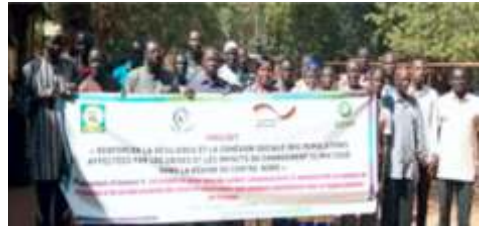
Photo de famille du cadre de concertation du SAP de Kaya sur le bilan des activités, tenu le 10 décembre 2024