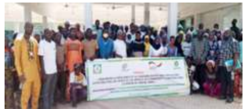
Photo de famille lors de la rencontre d'échanges et d'intermédiation entre les IMF et les bénéficiaires des AGR du projet BMZ dans la commune de Kaya, tenue à Kaya, le 15 novembre 2024