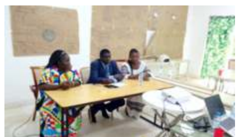
Clôture des travaux d'analyse des risques et de la vulnérabilité (VRA) de la commune de Kaya par le SGP Sanmatenga