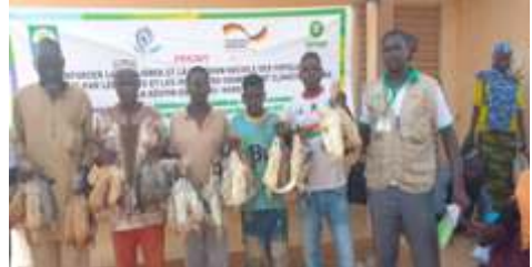
Distribution de la volaille à Kongoussi le 6 juin 2024