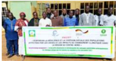
Photo de famille des participants à l'atelier de partage des informations sur la situation sécuritaire et nutritionnelle à Kongoussi