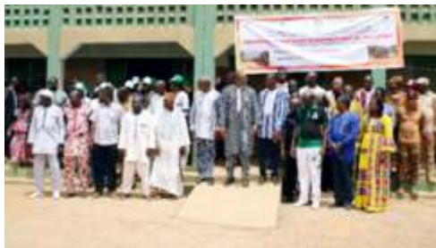
Participants à la remise officielle des infrastructures du projet BMZ aux autorités de la région du Centre-Nord