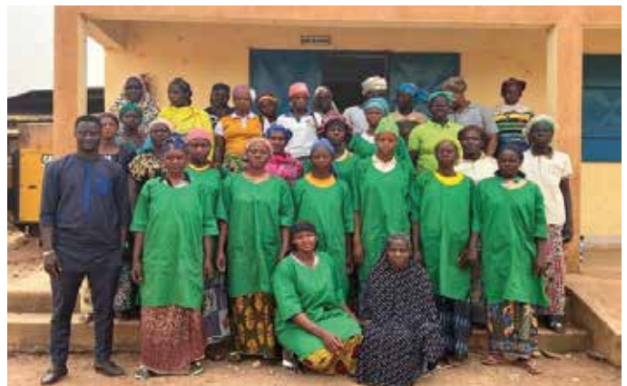
Rencontre d'échanges entre les membres pour répondre à la commande de la commune de Mogtéo