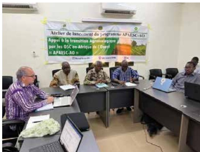
Lancement du programme Appui à la transition agroécologique par les OSC en Afrique de l'Ouest APAESC-AO

• Budgétisation sensible au genre : Oxfam a organisé un atelier de socialisation et de validation de l'étude sur la budgétisation sensible au genre en présence des acteurs étatiques, des organisations de la société civile, des organisations de femmes et du collège de la confédération paysanne du Faso. L'atelier a permis de déboucher sur une note de plaidoyer à diffuser auprès des décideurs.