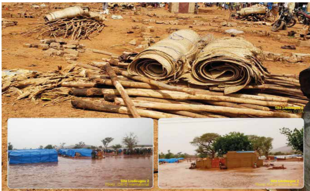
Vue des inondations dans la commune de Kongoussi