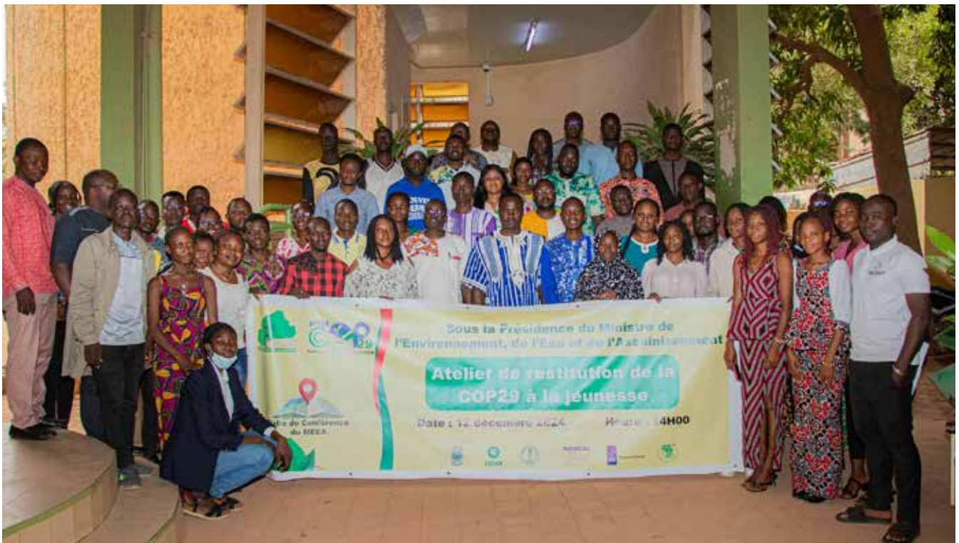
Atelier de restitution de la Cop 29 CONAJEC OXFAM

d'autres pays vulnérables font face, tout en plaidant pour une augmentation significative du financement de l'action climatique.