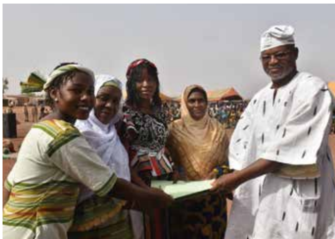
Photos de remise de la Note de déclaration des femmes de la Région des Koulsé aux autorités régionales lors de la commémoration de la Journée Internationale de la Femme à Kaya.

Région par les femmes rurales et les femmes déplacées internes et hôtes à la faveur de la cérémonie officielle de célébration du 8 mars ;