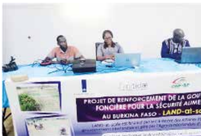
Formation des CIC de K. Vigué, Toussiana et Satiri (24 au 25/10/2025)

• Civisme fiscal : OXFAM et son partenaire CERA/FP on procédé à la simplification, à la traduction et à la conversion en capsules vidéo des budgets primitifs pour l'exercice 2024 des communes de Korsimoro, Nagréongo et Ziniaré. Ces budgets simplifiés ont été adaptés en vidéos animées, traduites en langue locale mooré, afin de fournir aux communautés des