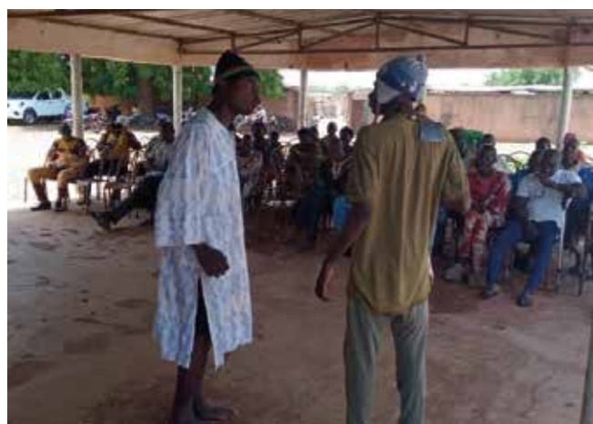
Séance de sensibilisation grand public - Ouarkoye [04/07/2024]