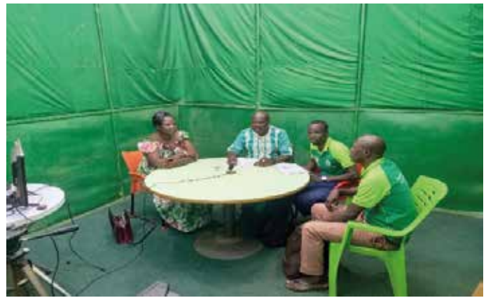
Sensibilisation dans les médias sur la cohésion sociale

cardinales que nos coutumes, nos traditions et nos religions nous recommandent pour construire une vie en société débarrassée de la violence.