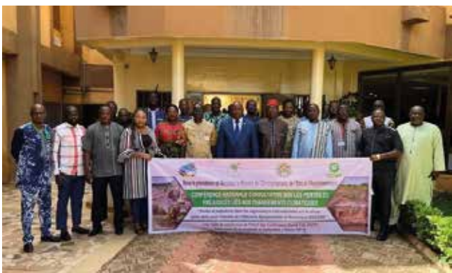
Conférence Nationale sur les pertes et préjudices 2024

• Pertes et préjudices : Oxfam au Burkina Faso a continué à animer un espace de dialogue sur la justice climatique créée en 2022 sur les pertes et préjudices. C'est ainsi que la troisième Conférence nationale sur les pertes et préjudices, tenue les 12 et 13 septembre 2024 à Ouagadougou, a réuni 45 participants issus de l'administration, des ONG, des organisations paysannes et de la société civile. Afin de documenter et de sensibiliser sur les impacts du changement climatique, un récit sous le format vidéo a été produit et diffusé par la Confédération Paysanne du Faso (CPF). Ce récit a mis en lumière les effets des inondations récurrentes sur les agriculteurs et les pertes qu'ils subissent.