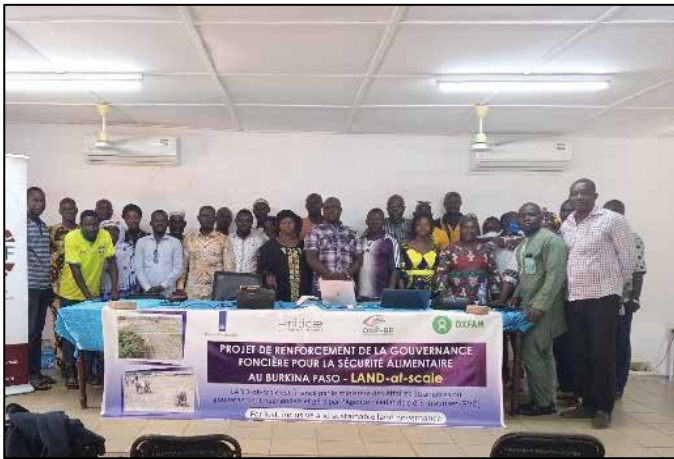
Participants formation de K. Sambla et Péni (22 au 23/10/2024)