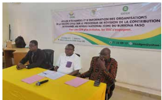
Atelier d'information des Organisations de la Société Civile (OSC) sur la révision de la Contribution Déterminée au niveau National (CDN) du Burkina Faso, 6 mars 2025 à Ouagadougou.

SPONG, en partenariat avec Oxfam et le SP-CNDD, il a réuni 58 participants issus de 46 OSC. L'objectif principal était d'informer et d'impliquer les OSC dans le processus participatif d'élaboration de la CDN 3.0. Trois communications ont été données et ont porté sur : les travaux antérieurs du SPONG et d'Oxfam, les fondements et le contenu de la CDN 2.0, et le processus de révision en cours. Les participants ont formulé plusieurs recommandations sur la prise en compte du genre, des personnes handicapées, des projets climat et du suivi-évaluation.