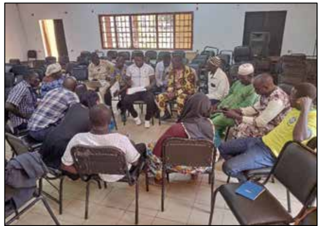
Travaux de groupes participants de K. Sambla et Péni '22 au 23/10/2024)