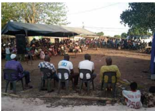
Séance de sensibilisation grand public (Péné [20/04/2024])

• Sécurité foncière : Oxfam et ses partenaires à travers la CPF ont rédigé un memorandum sur la promotion immobilière et foncière au Burkina Faso pour interpellier le Gouvernement à :