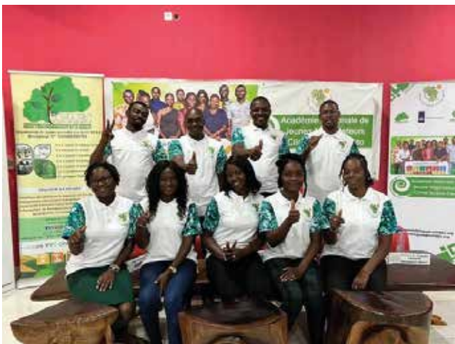
Académie nationale des jeunes négociatrices, négociateurs climat organisée

sur la vulnérabilité des communautés, en particulier des femmes et des enfants, en raison des conditions socio-culturelles et économiques. L'Écosse a été appelé à renforcer son engagement pour le Fonds de pertes et préjudices, en soutenant des solutions locales et un accès direct aux fonds pour les communautés vulnérables. Ils ont aussi salué le leadership écossais pour une transition énergétique juste. Le représentant écossais, Gillian Martin, secrétaire d'État par intérim pour le Net Zéro et l'Énergie, a pris en compte les suggestions pour renforcer l'influence de l'Écosse et motiver d'autres gouvernements à passer à des contributions effectives au Fonds P & P.