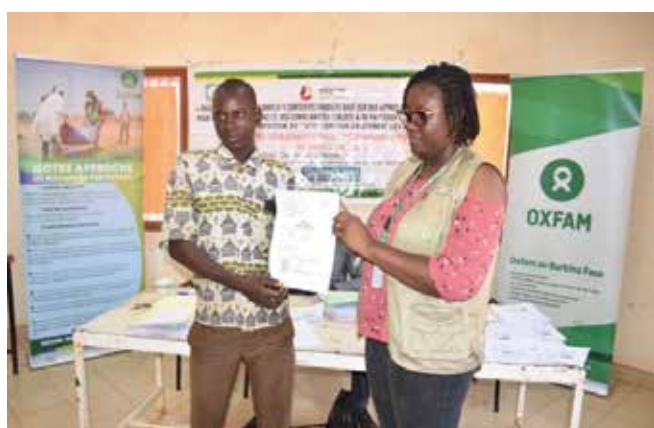
Remise d'extrait acte de Naissance

L'accès à la documentation civile renforce la protection des populations vulnérables en réduisant leur exposition aux violences, notamment les VBG.