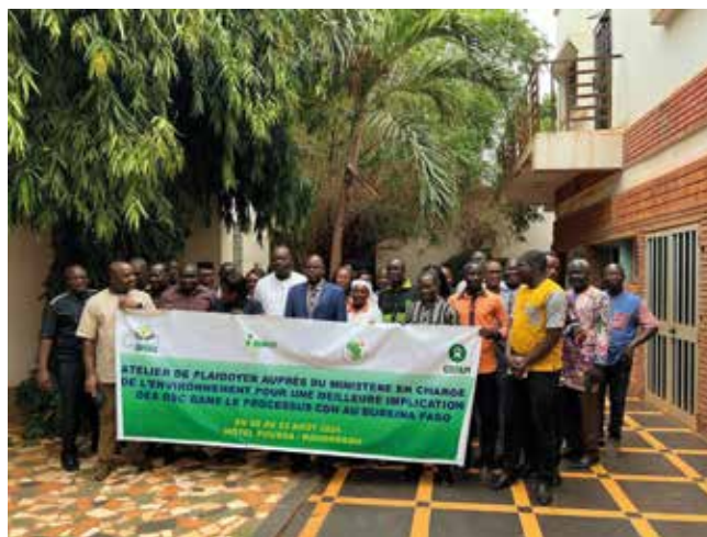
Climat, plaidoyer pour une meilleure implication des Organisations de la Société Civile dans la formulation, la mise en œuvre et le suivi évaluation et capitalisation

• Accès au financement climat : Oxfam au Burkina Faso et Oxfam intermon ont co-publié le rapport « NI SUFFISANT, NI ADÉQUAT Une évaluation participative sur les obstacles à l'accès local aux financements climat dans le Sahel. » en marge de la COP 29. Ce rapport présente les résultats d'une recherche participative menée dans quatre pays du Sahel (Burkina Faso, Mali, Sénégal, et Tchad) avec plus d'une centaine d'acteurs intervenant aux niveaux local et national, présentant des informations de première main permettant d'énumérer et de dévoiler les principaux obstacles et facteurs structurels qui bloquent l'accès aux financements climat dont ils ont tant besoin pour être en mesure de fournir des solutions climatiques.