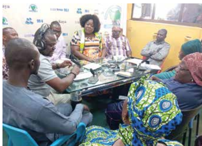
Emission radiophonique, à Kaya sur le thème du 8 mars 2025, « Crise sécuritaire et humanitaire au Burkina Faso : quelles stratégies pour promouvoir l'entrepreneuriat agricole des femmes »

• Soutien au plaidoyer des femmes rurales : Oxfam au Burkina Faso a apporté un soutien à ses partenaires (La Confédération Paysanne du Faso, l'Union Nationale des Mini-laiteries et producteurs de lait local du Burkina (UMPLB), l'Alliance Technique d'Assistance au Développement (ATAD) et l'Association Soutenir l'Émergence et la Valorisation de l'Économie locale en Afrique (SEVE Africa) pour l'organisation d'activités de communication et de plaidoyer pour marquer la célébration de la journée internationale de la femme le 8 mars 2025 dans la Région du Kuisé (Centre Nord).