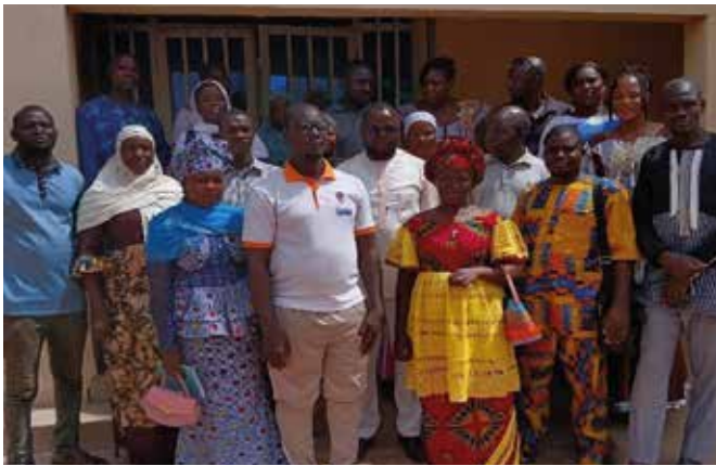
Renforcement des capacités des partenaires, des communautés PDI et hôtes sur la cohésion sociale.