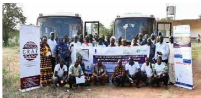
Départ de la délégation pour Padéma le 29 octobre 2024

Lors de la rencontre de suivi du projet avec les autorités communales de Toussiana, la PDS a souligné que les cellules d'interpellation citoyenne jouent un rôle crucial en permettant aux citoyens de s'engager activement dans la vie publique et de faire entendre leur voix auprès des décideurs. Elles offrent un cadre structuré pour que les citoyens puissent questionner, exprimer des préoccupations, et proposer des solutions sur des sujets d'intérêt général,